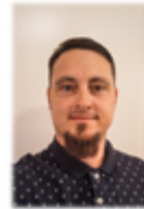
Georg Milocco Öffentlichkeitsarbeit